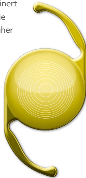
Abbildung: AcrySof® IQ ReSTOR® Kunstlinse

Die Linsenoperation gehört heute zu den sichersten und am meisten ausgeführten medizinischen Eingriffen überhaupt. Sie erfolgt meist ambulant und wird in wenigen Stunden unter lokaler Betäubung durchgeführt. Der Linsenkern wird zerkleinert und abgesaugt, um dann die Kunstlinse einzusetzen. Früher musste der Arzt das Auge aufschneiden und mit winzigen Instrumenten bearbeiten. Heutzutage können die meisten Schritte mithilfe eines Lasers durchgeführt werden, klingenfrei und äußerst präzise, da computergesteuert.